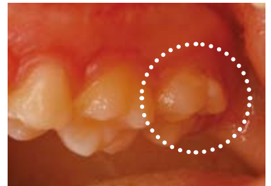
図4 右上7番の頬側は、唾液の影響を受けにくいのでカリエスリスクが高い TePeミニを使用することで柔らかな毛先は脱灰部にダメージなくブラークコントロールが可能に

港町歯科クリニックでは、プロフェッショナルティースクリーニング(以下PTC)でTePeの気持ちよさをその場で体感していただくと、多くの方が、クリームのような泡立ちとブラッシングの気持ちよさに驚き、感動して購入する患者さんが多くいらっしゃいます。