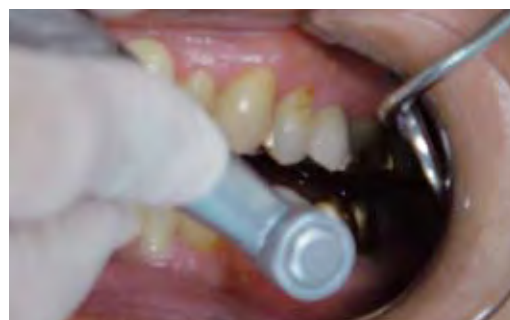
キーリスク部位は慎重に操作する