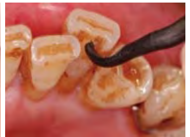
舌面に沈着した着色物の除去にも有用 (4R/4Lを使用)