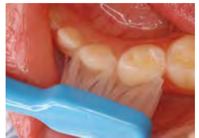
図2 TePeミニは乳歯の歯間部、歯頸部にぴったりとフィットし磨きやすい