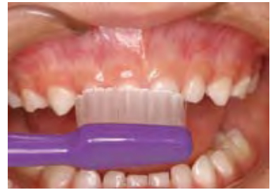
図1 TePeセレクトコンパクトでPTCを行っている 前歯の部分への毛先のあたり方は十分だが保護者は大きいと感じる