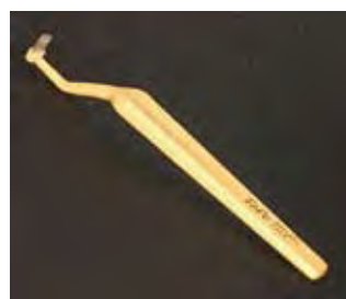
インプラント専用歯ブラシ TePe インプラントケア

このインプラントケアは明らかに柄の形からして特殊で「従来の物と違う歯ブラシ」という貴禄があります。