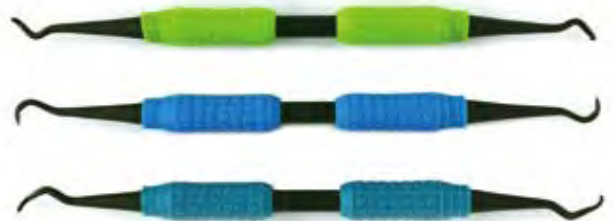
マイルド・スケーラー

口腔の健康は全身の健康に大きく関与しています。口腔の疾患予防と管理、健康の保持増進、リハビリテーションによりQOLの向上につながります。その一役を担う私たち歯科衛生士は、最新の口腔衛生ツールにも目を向け、より質の高いプロフェッショナルケアを提供できるよう、スキルアップしていきましょう。