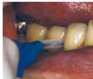
(図3) 天然歯の方も金気を感じないと好評 でインプラントにも安心して使用 できる

インプラントのメンテナンスの目的は、インプラント体に適切な上部構造が装着された後、その機能が長期的に良好に維持されていくことであると考えます。生涯に渡って継続していくメンテナンスに、歯科衛生士は主体的に関わっていくこととなります。そのために、患者さんとの信頼関係を構築するための高いコミュニケーション能力や、天然歯とインプラントの周囲組織の相違点などインプラント療法に関する専門的な知識が必要です。そのような知識を身につけた上で、患者さんにはセルフケアの確立と実行をしていただけるようお話をし、私たちは定期的なプロフェッショナルケアの技術を提供していきます。セルフケアにおいて特に留意する点は、インプラントの上部構造の特徴や、周囲環境を考慮した適切なプラークコントロールです。プロフェッショナルケアでは、インプラント部位に使用する器具に配慮します。付着物を除去するためにハンドスケーラーを用いる場合は、プラスチックスケーラーやカーボンスケーラー、チタン製スケーラーの使用が推奨されます。超音波スケーラーを使用