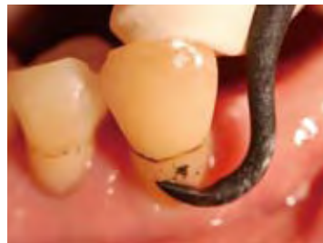
コンポジットレジン修復の表面は、根面損傷が比較的少ない (H6/H7を使用)