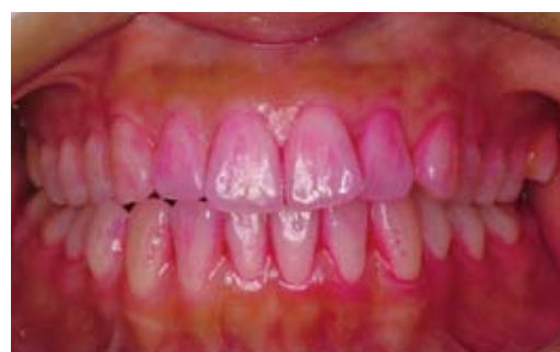
染め出し後の口腔内

患者さんにケアを提供する時に、私が第一に考えるのは、「患者さんにとって優しいケア」です。患者さんにとって快適であること、歯にダメージがないこと、確実な効果が期待できること、いろんな意味での「優しいケア」をこれからも提供していきたいと考えています。