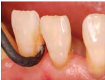
黒色であることから、プラークの除去具合の判別がしやすい (H6/H7を使用)