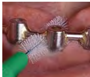
(図2) ワイヤーがプラスチックコーティ ングされているのでインプラントに も安心して使用できる

そして、なんと言ってもお勧めはサイズが豊富な歯間ブラシ。メタルワイヤーがプラスチックコーティングされているので、インプラントの方にも安心して使っていただけます（図2）。天然歯の方も金気を感じないと好評で（図3）、根面が露出している場合やオーバーブラッシングになりがちな方にも安心してお勧めできます。エクストラソフトタイプは、通常の歯間ブラシよりもブラシが柔らかく、歯周炎やインプラントの患者さん、粘膜疾患をお持ちの方にも向いているようです。