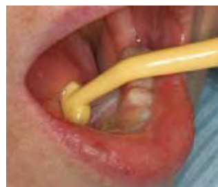
下顎の舌側使用例

そしてその形状から普通の歯ブラシではできない便利な使い方ができます。特に下顎舌側の歯肉と上部構造の境目付近など従来の歯ブラシで磨きづらかった場所でこの歯ブラシが威力を発揮します。