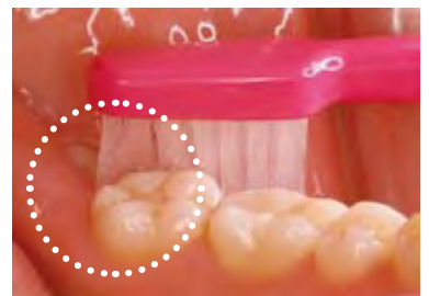
図3 半萌出智歯部、7番遠心にも毛先があたりやすいため患者さんに大変喜ばれています