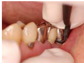
金属冠の表面に付着した歯石除去も金属面を傷つけにくい (204Sを使用)