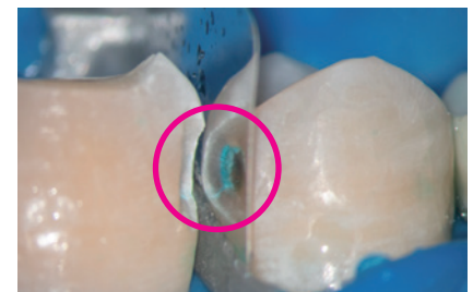
図3. プレップの表面を活用し窩洞を確認