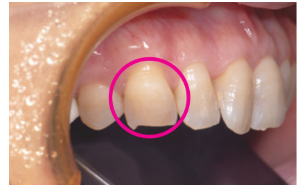
図1. #13 遠心隣接面カリエス

https://www.youtube.com/watch?v=-41dWWsYSQ4&feature=youtu.be