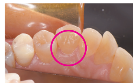
図4. 歯間空隙は約一週間で閉じる