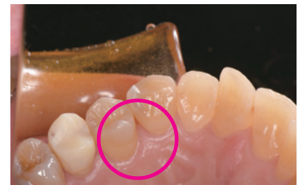
図2-1. 矯正用のセパレーターを用いて