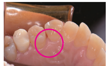
図2-2. 歯間離開を行う