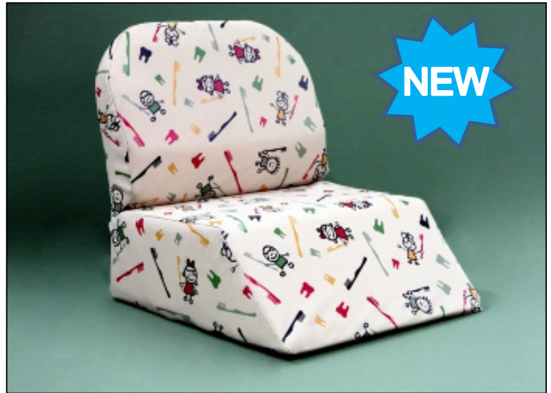
*写真はチャイルドシート・イラスト入り