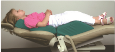
*写真は通常カバー(イラスト無し)のチャイルドシートとヘッドレストを併用した例