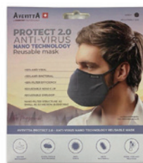
清潔な1枚入パック