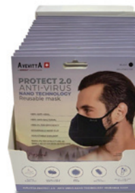
20枚入ディスプレイパック (1枚入パック×20)