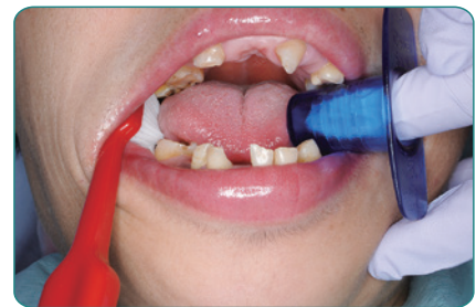
写真はフィンガーブロック L (青)