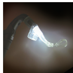
マウスピースを通して光が拡散