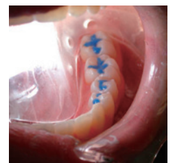
明るく照らし出された術野