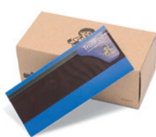
ブルー 100 枚 / 箱