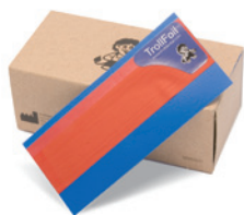
レッド 100 枚 / 箱