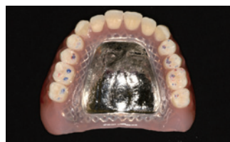
トロール咬合紙 (赤: 中心咬合位 青: 側方運動) による上顎義歯の咬合印記状態