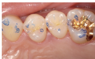
トロール咬合紙 (赤: 中心咬合位 青: 側方運動) による天然歯の咬合印記状態