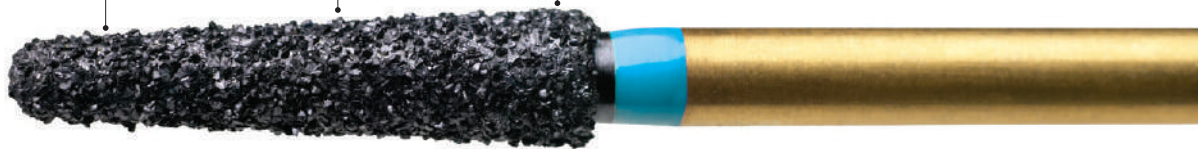
プレデタージルコニア Z856-018M