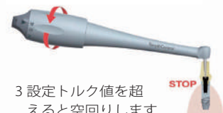
3 設定トルク値を超えると空回りします

商品の内容・価格・仕様・デザイン等を予告なく変更する場合があります。無断転載禁止。